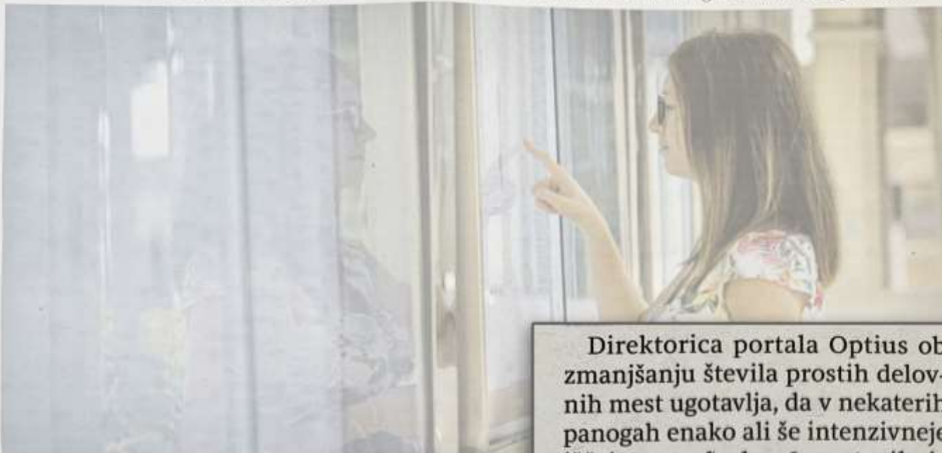
Marsikdo med tistimi, ki je delo izgubil v času pandemije koronavirusa ali zaradi nje, se z brezposelnostjo srečuje vsak dan.

Po koronavirusu Podjetja prilagajajo poslovne modele, potrebovala bodo tudi drugačne veščine zaposlenih